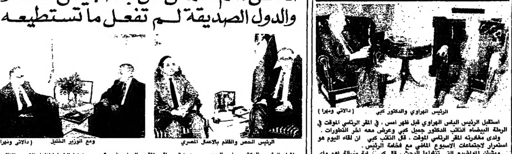
الرئيس الحصن والقائم بالأعمال المصري ومع الوزير الخليل (الداخلي ويهرا)

استقبل الرئيس اليماني اليماني الهراوي قبل ظهر امس في المقر الرئيسي الموقت في الريف البيضاء الثالث الدكتور كبي وعرض معه آخر التطورات. واستمر الاجتماع اربعين دقيقة مع ختامه في الساعة الواحدة.